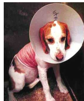
тест на раздражение кожи

Самые жестокие опыты проводит Procter & Gamble .