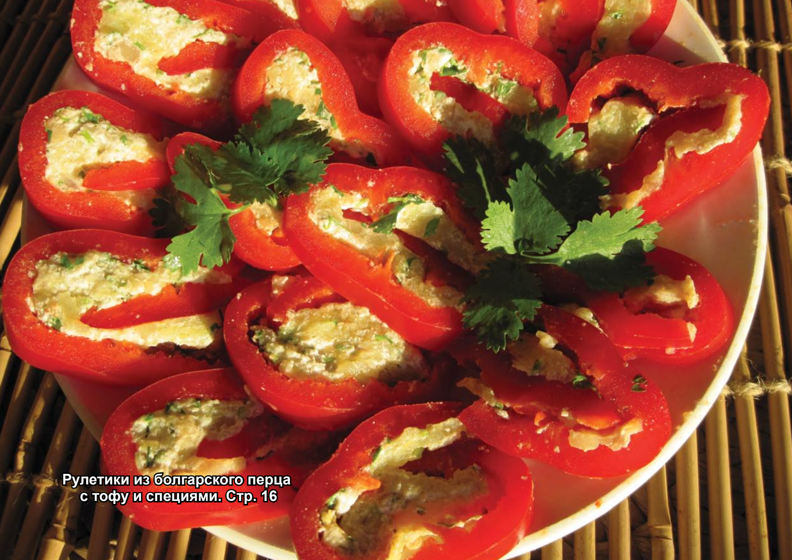
Рулетики из болгарского перца с тофу и специями. Стр. 16