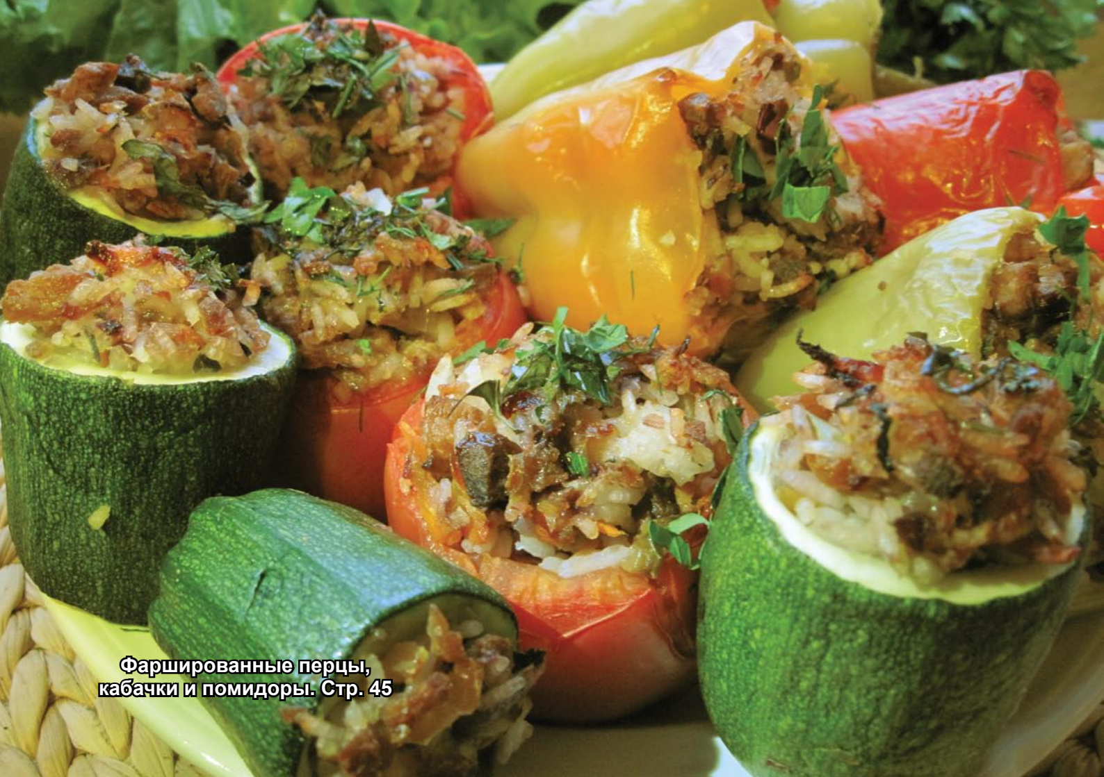
Фаршированные перцы, кабачки и помидоры. Стр. 45