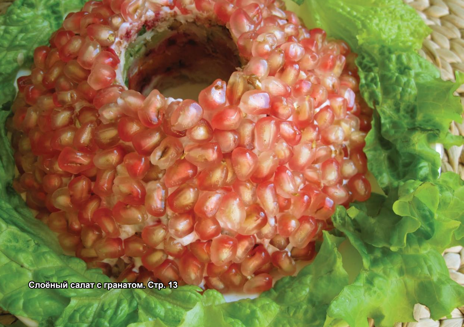
Слоёный салат с гранатом. Стр. 13