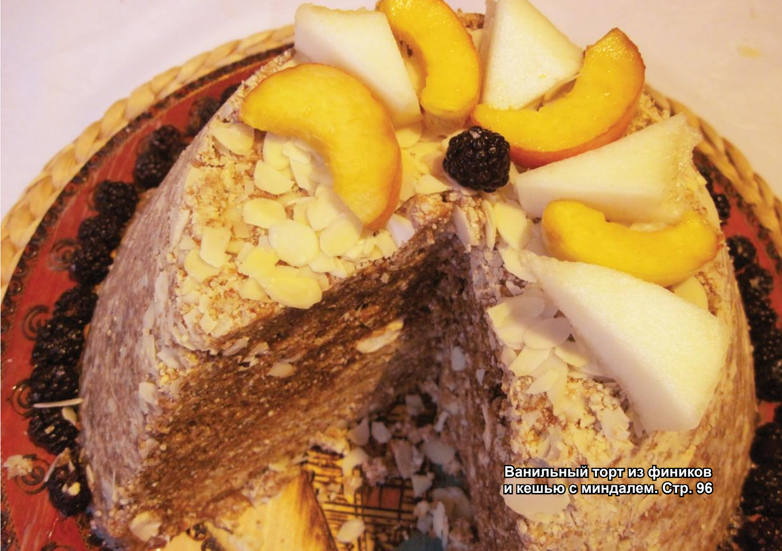
Ванильный торт из фиников и кешью с миндалем. Стр. 96