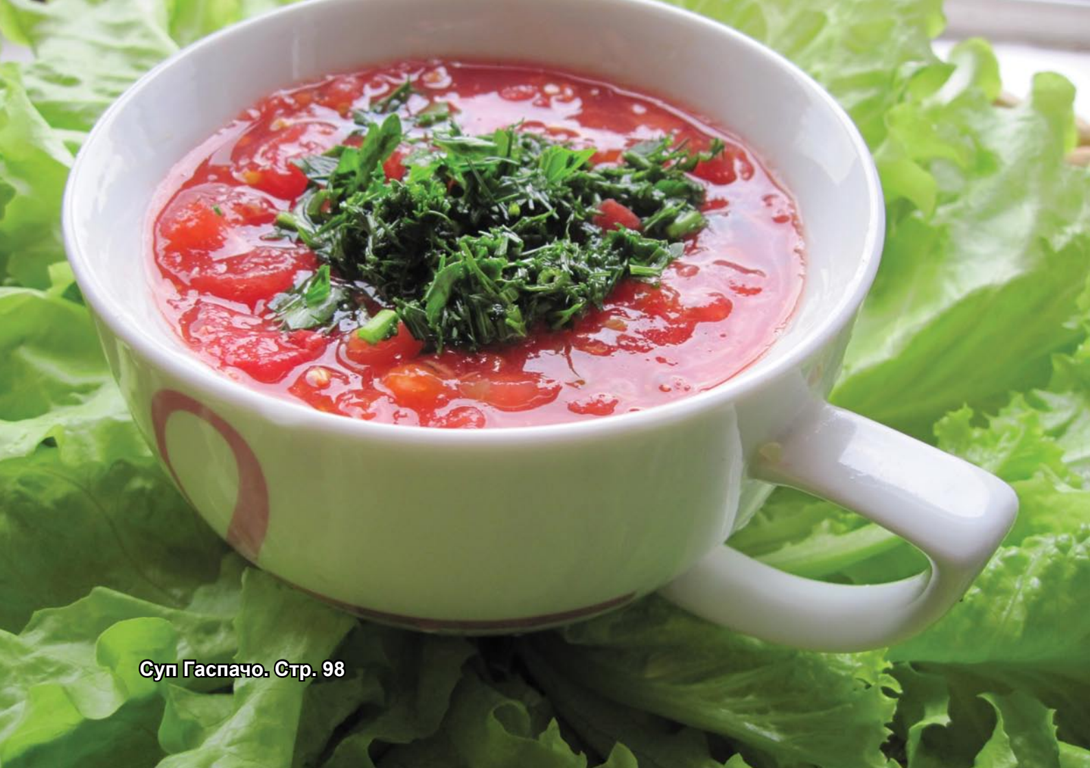
Суп Гаспачо. Стр. 98