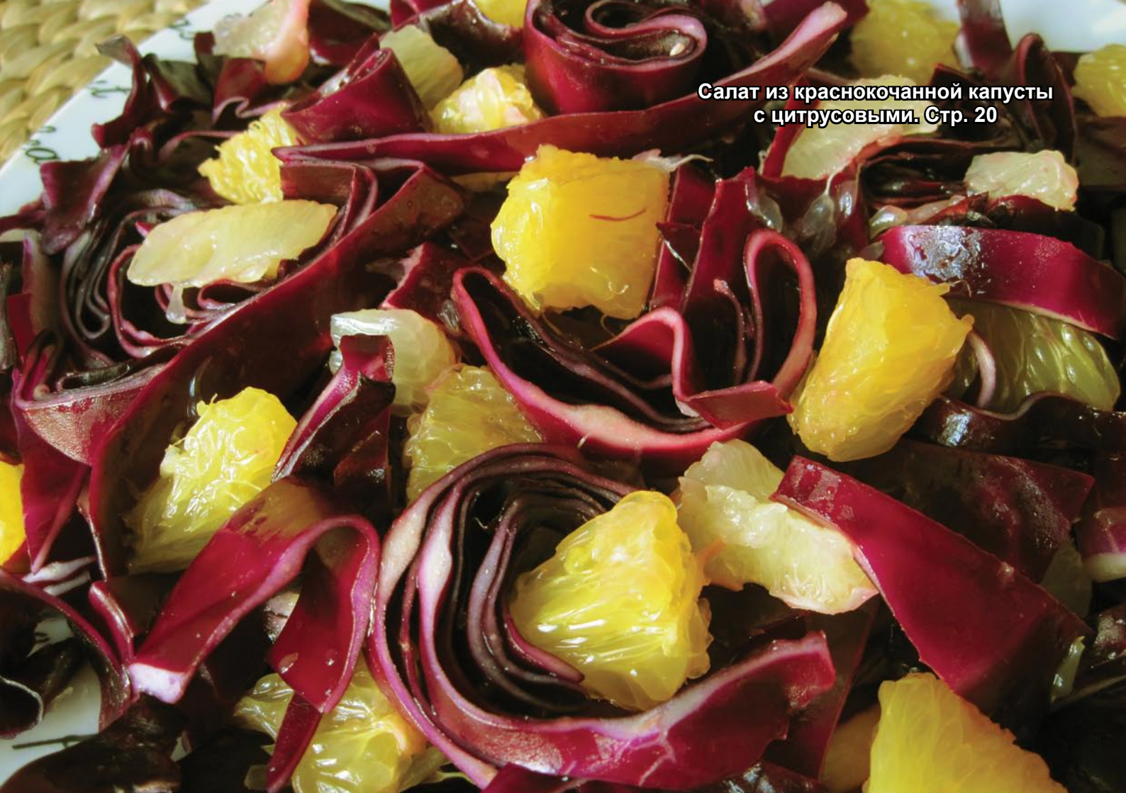
Салат из краснокочанной капусты с цитрусовыми. Стр. 20