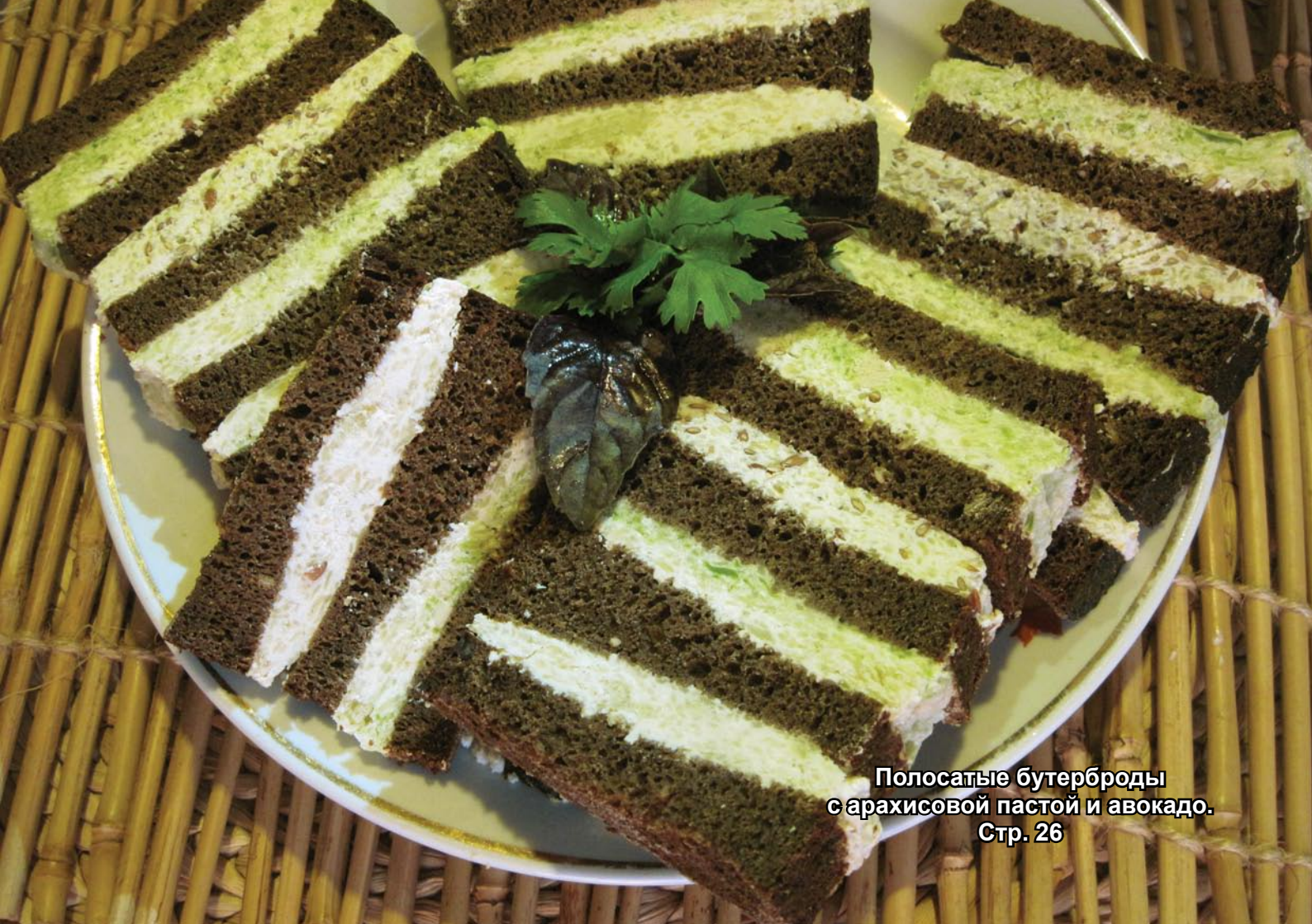
Полосатые бутерброды с саракисовой пастой и авокадо. Стр. 26