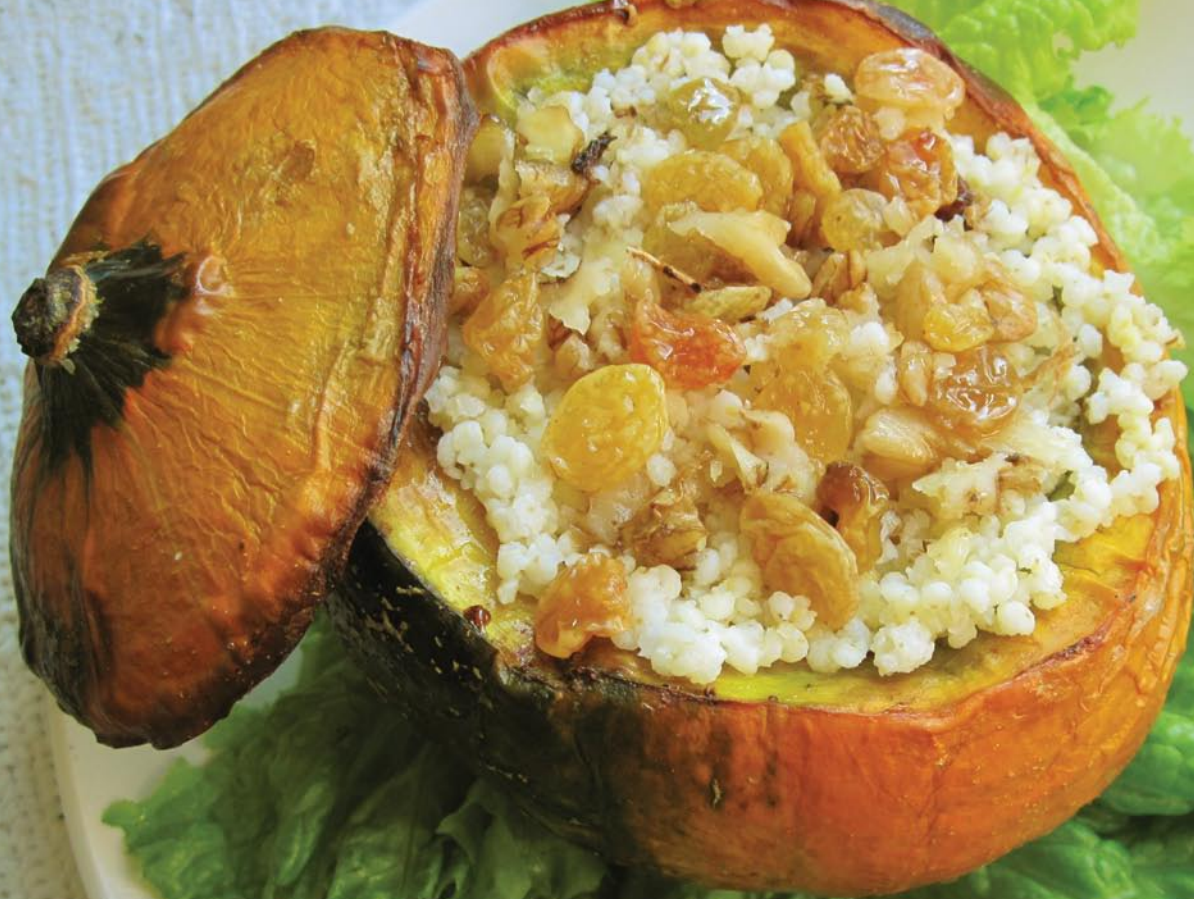
Печёная тыква с пшеном, изюмом и грецкими орехами. Стр. 44