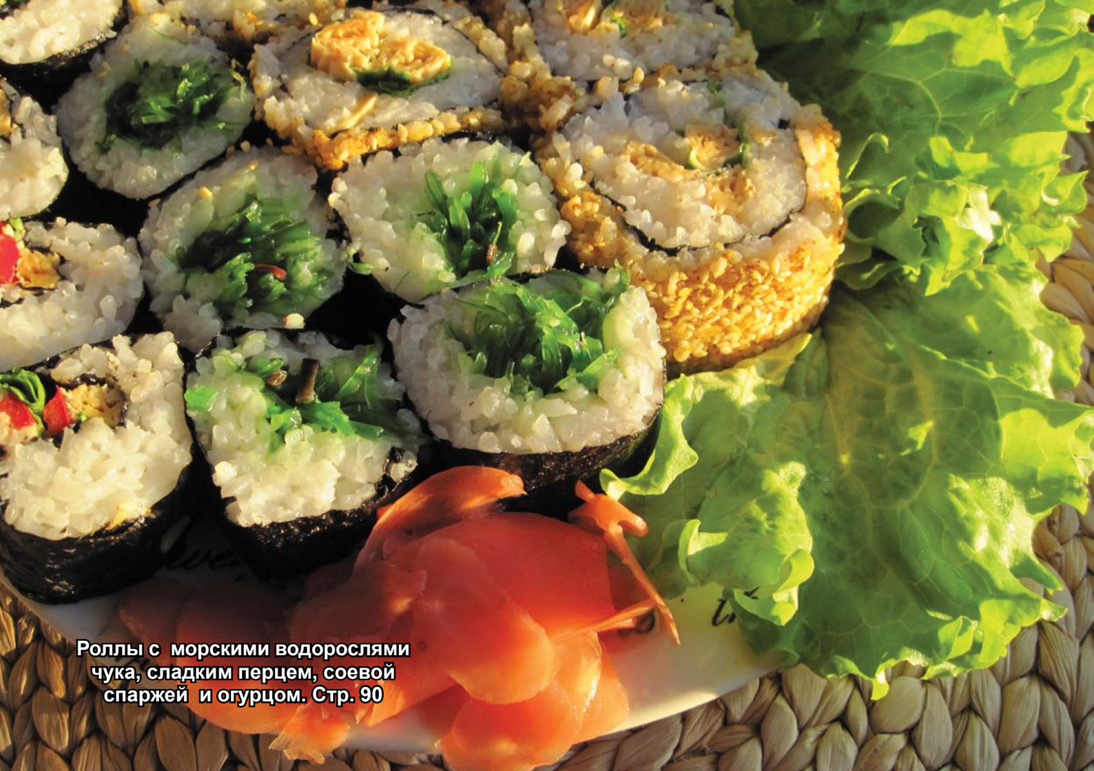
Роллы с морскими водорослями чука, сладким перцем, соевой спаржей и огурцом. Стр. 90