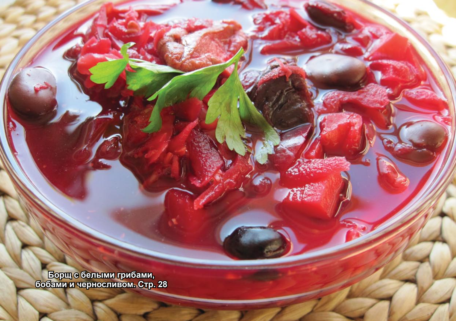
Борщ с белыми грибами, бобами и черносливом. Стр. 28