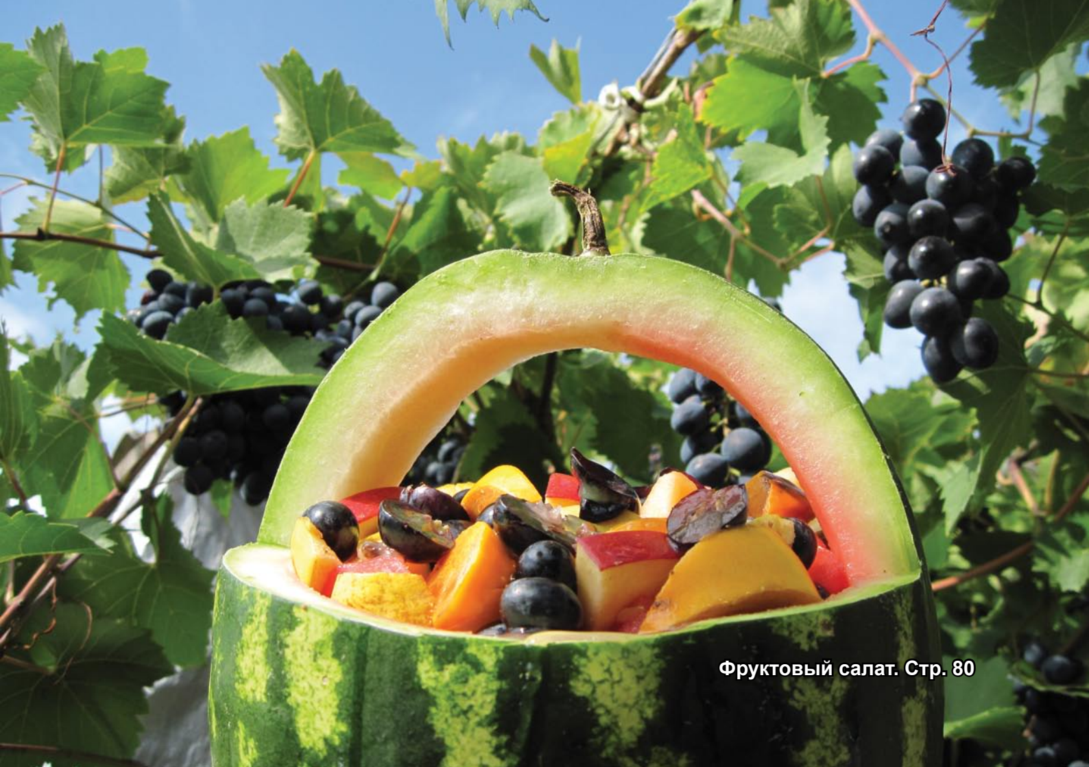
Фруктовый салат. Стр. 80