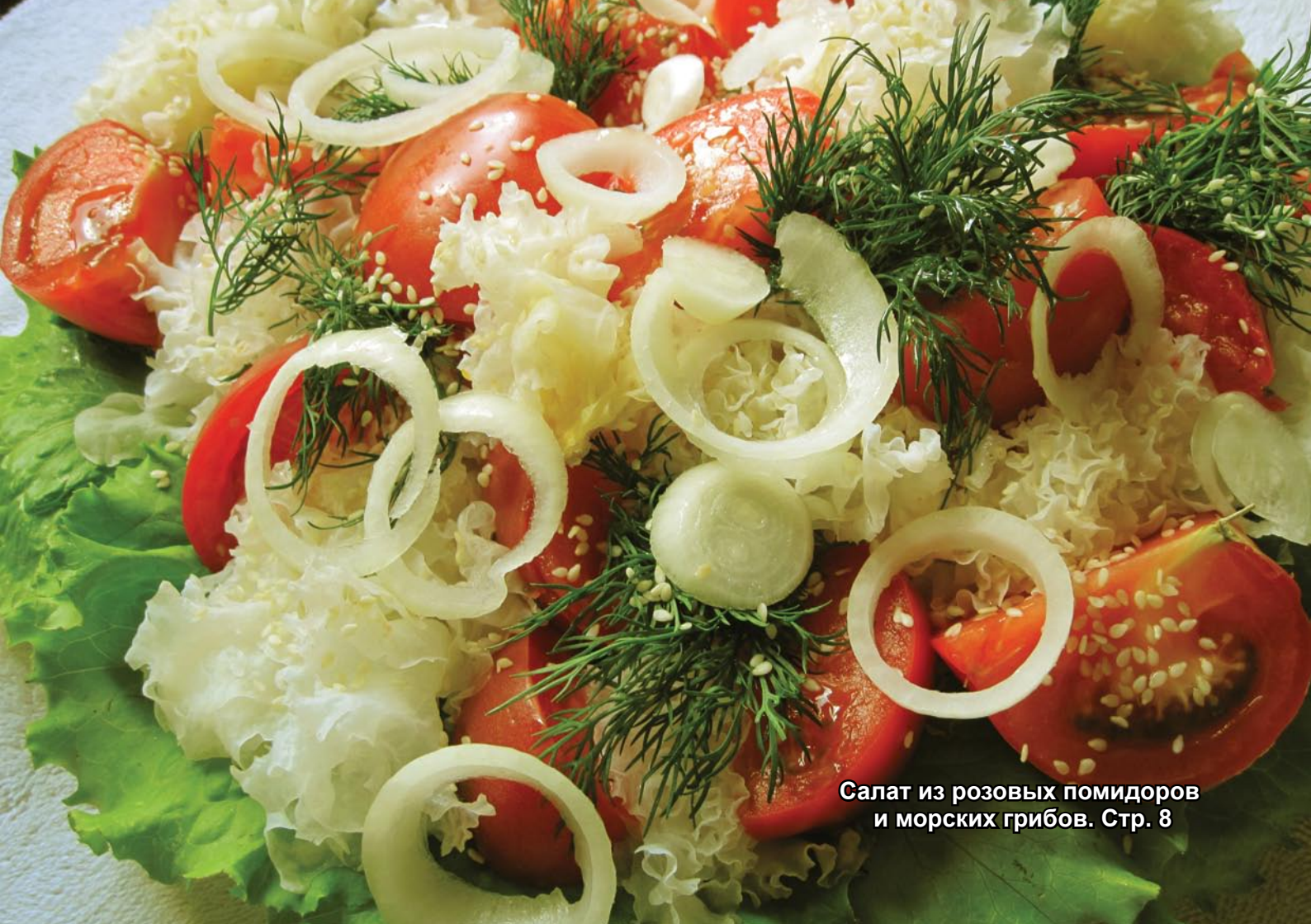
Салат из розовых помидоров и морских грибов. Стр. 8