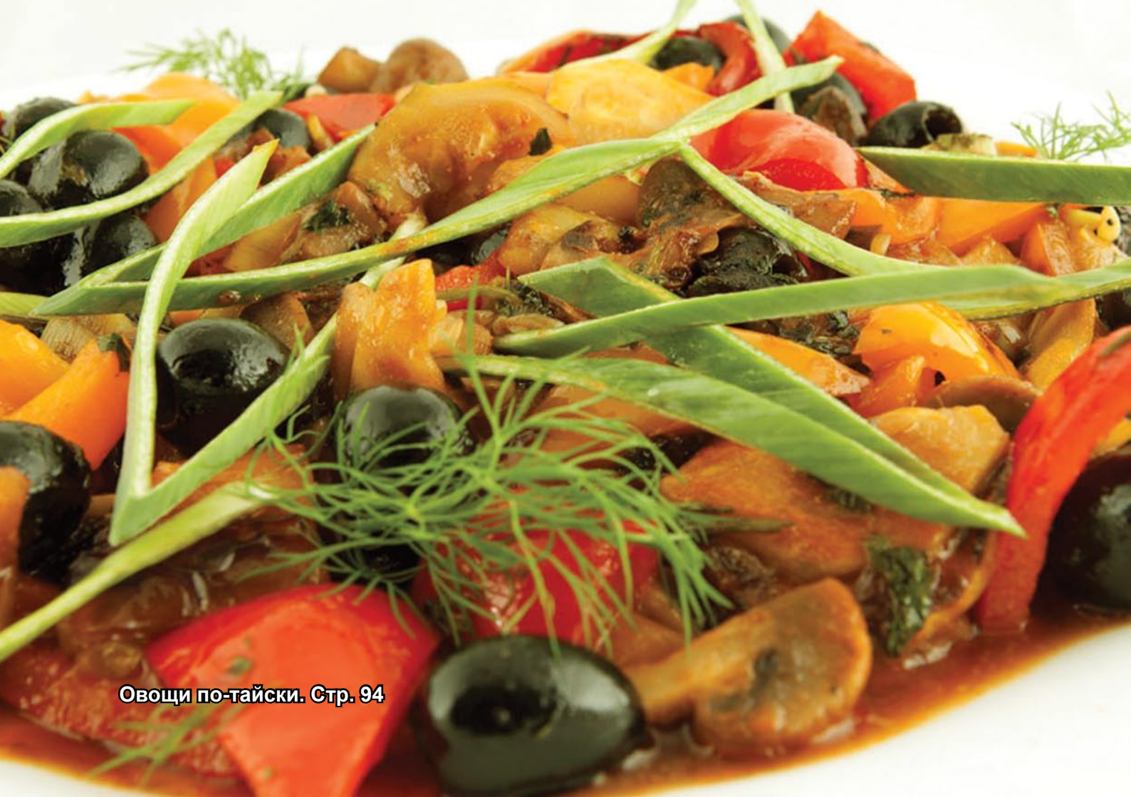
Овоци по-тайски. Стр. 94