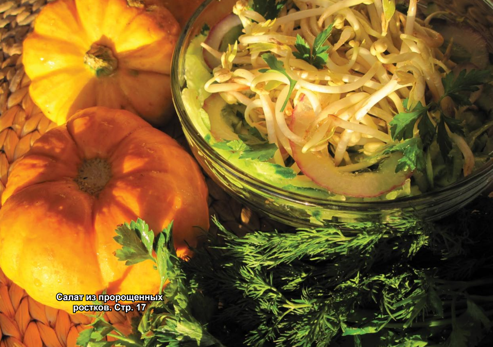
Салат из пророщенных ростков. Стр. 17