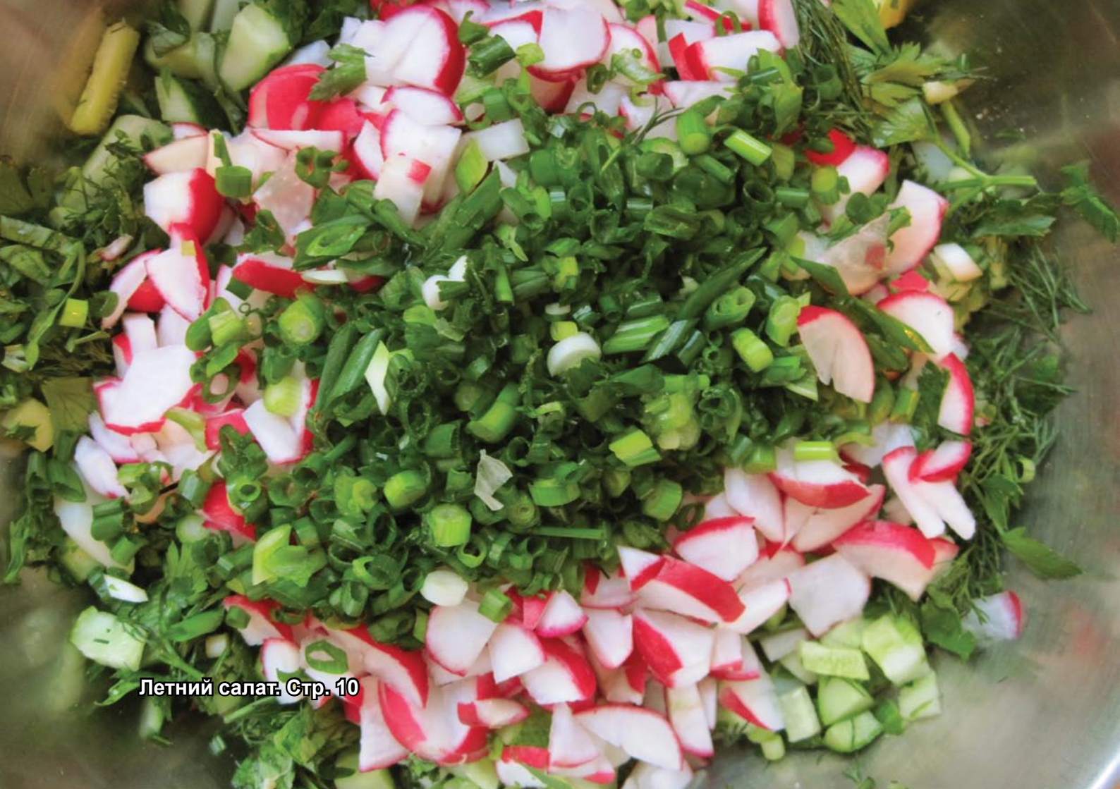
Летний салат. Стр. 10