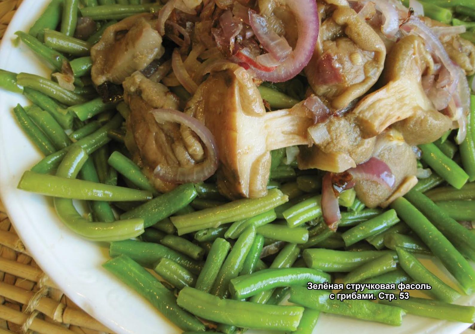
Зелёная стручковая фасоль с грибами. Стр. 53